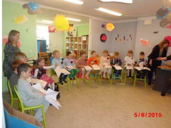
Við skólasliti, allir að útskrifast