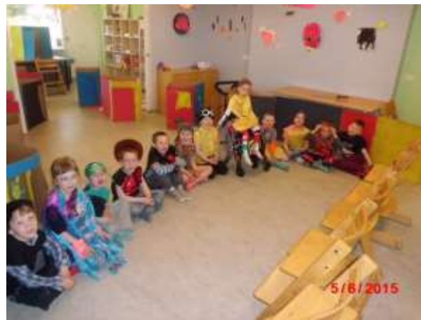
Komin í búningana og tilbúin að leika, bíða eftir að mamma og pabbi komi

Þegar æfingar hefjast er mikil eftirvænting í barnahópnum. Þau þurfa að viðá að sér ýmiss konar fylgihlutum til að gera leikritið tilkomumeira eða búa þá hreinlega til sjálf. Þetta hefst allt með samvinnu barnanna og góðum stuðningi leikskólakennaranna. Þegar hér er komið sögu er fátt annað eftir en að sýna afrakstur þessarar miklu, skemmtilegu og lærdómsríku vinnu barnanna.